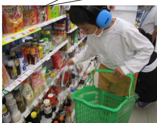
小B2 『みんなのたんぼーる らんどであそぼう』