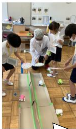
小B3 『おもちゃのくにてあそぼう』